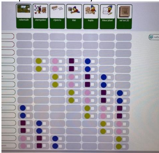
foto: planning ontwikkelplein (elke kleur staat voor een bepaalde dag)

stippen. Dan zijn ze dus voor de 3 e keer met een bepaalde activiteit bezig. De kinderen hebben vrijheid in de activiteiten waar zij voor kiezen, maar dienen zich wel daarbij aan de afspraken te houden. Zij leren hiermee om doordachte keuzes te maken.