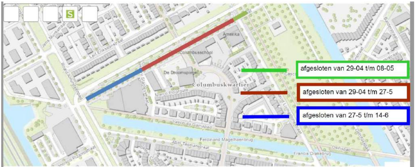
Planning en globale fasering werkzaamheden Henry Stanleystraat.